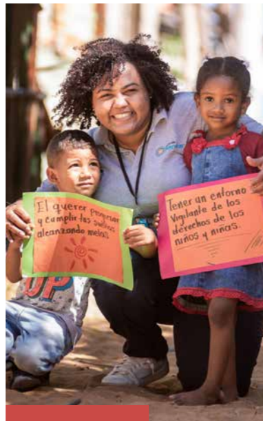
COLLECTE KERK IN ACTIE WERELDDIACONAAT