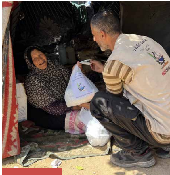
COLLECTE KERK IN ACTIE ZENDING