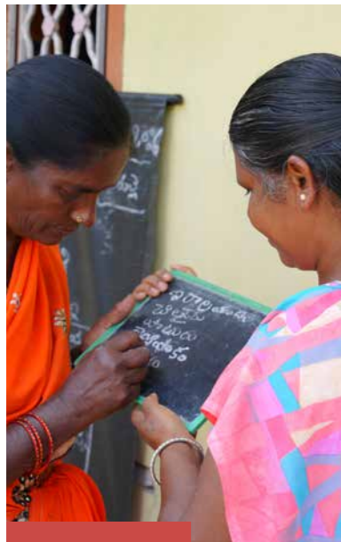
COLLECTE KERK IN ACTIE ZENDING