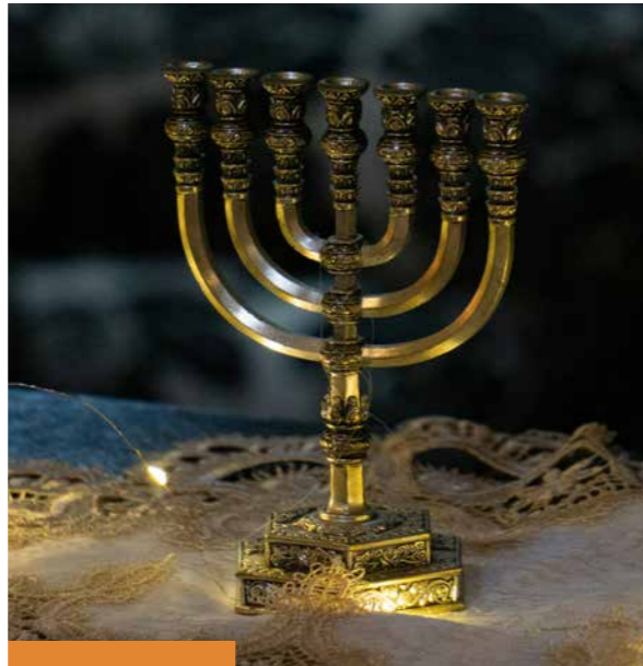
ISRAËLZONDAGCOLLECTE PROTESTANTSE KERK KERK & ISRAËL

Meer lezen kerkinactie.nl/versterkdekerk